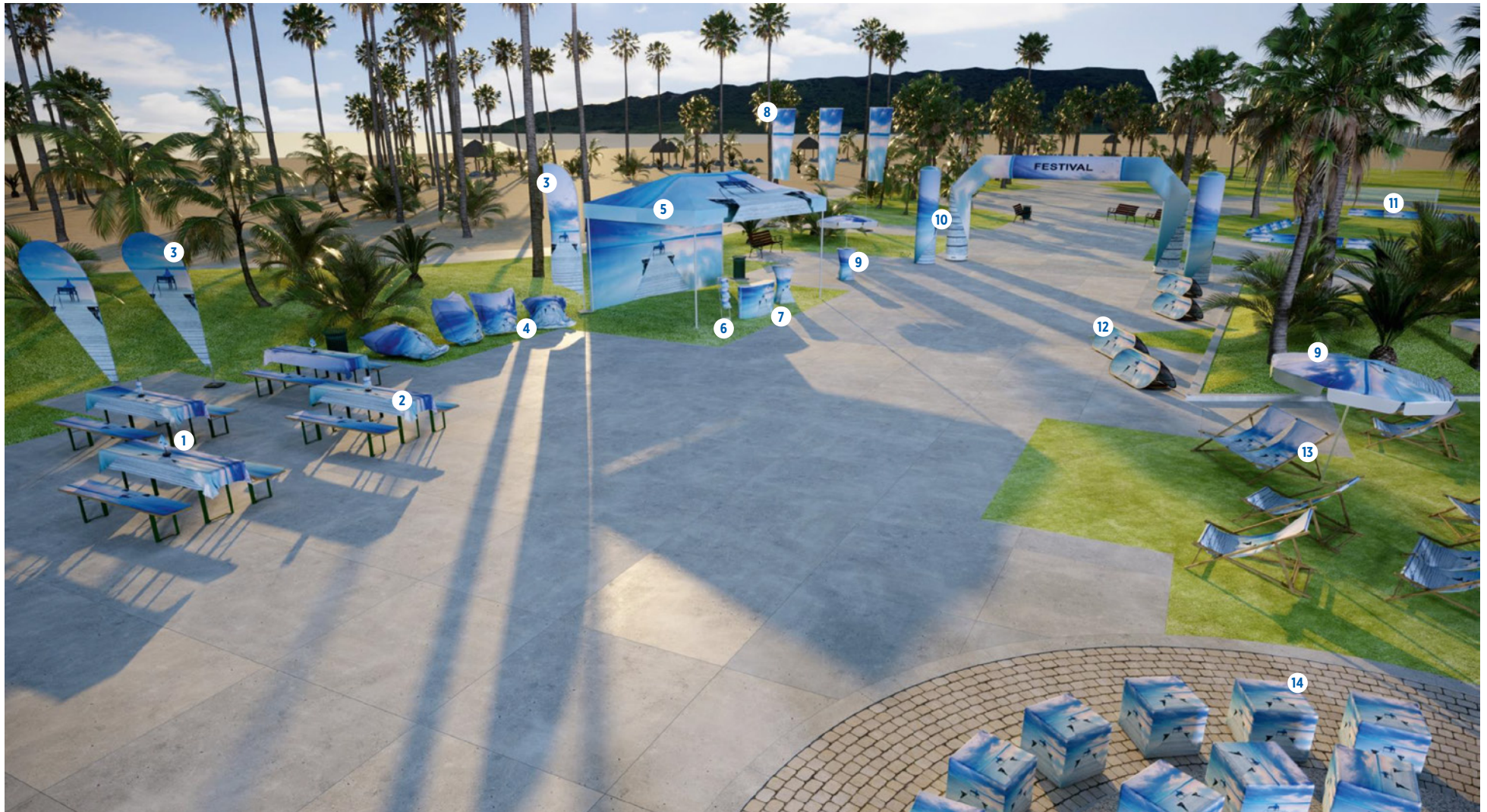
1) Tischbanner/Tischwimpel. 2) Stofftischdecken. 3) Beachflags. 4) Sitzsäcke. 5) Faltpavillons/Faltzelte. 6) Mobile Prospektständer. 7) Mobile Theken. 8) Mobile Fahnen/Fahnenmasten. 9) Sonnen- und Werbeschirme. 10) Aufblasbare Säulen/Formen. 11) Softreiter. 12) Jump-up Board. 13) Liegestühle. 14) Sitzwürfel.