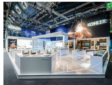
Messen und Events