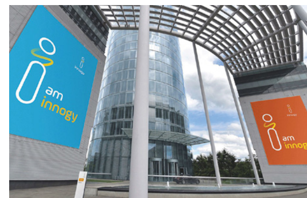
Einführung Beispiel Innogy in XXL: Blow-ups, Megaprints oder Großformate.

vor Ort und stellen so sicher, dass die Banner auch extremen Wetterbedingungen wie starkem Wind standhalten können.