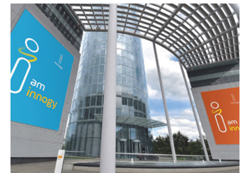
Fahnen, Banner und Displays