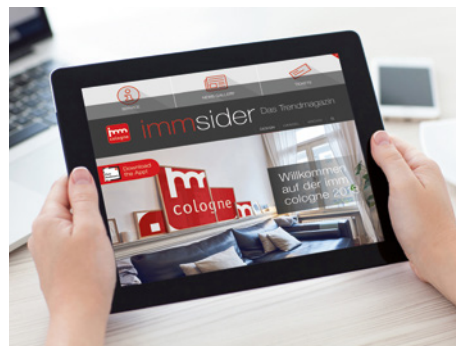
Print- und Online-Kommunikation