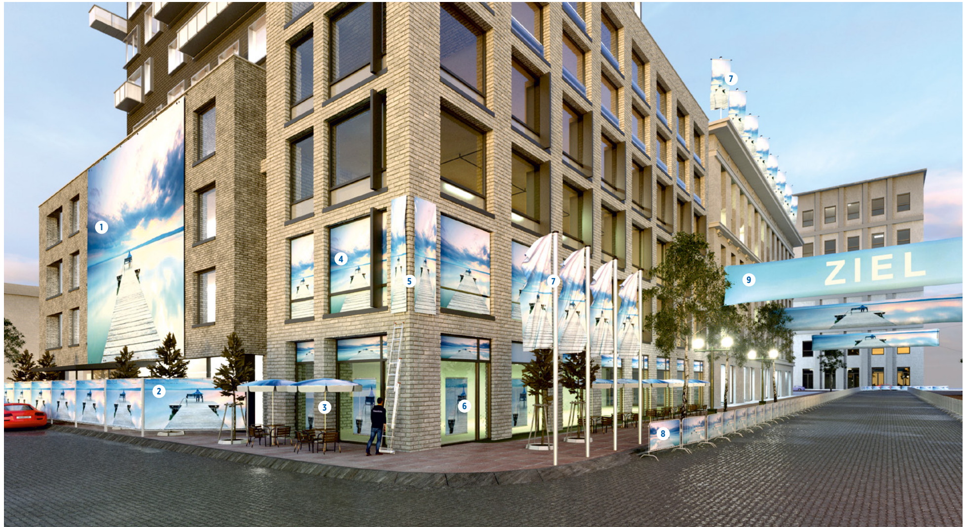
1) Großformate und Fassadenbanner. 2) Bauzaun- und Gerüstbanner. 3) Sonnenschirme. 4) Fensterbeklebung. 5) PVC-Banner. 6) Dekofahnen für den POS. 7) Fahnen und Fahnenmasten. 8) Absperrgitter, PVC/Meshbanner. 9) Spannbänder.